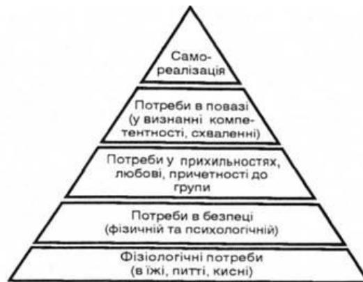
Рис. 2. Піраміда Маслоу

Бюджетування окремих структурних підрозділів є рішенням, яке абсолютно необхідне для будь-якого суб'єкта економічної діяльності, що діє в умовах ринкової економіки. В адміністративно-плановій економіці домінуючим важелем мотивації персоналу до підвищення якості було моральне стимулювання з елементами економічного стимулювання. Ринкова економіка висуває економічний важіль стимулювання в якості основного, елементи морального стимулювання пропорційні складовим частинам піраміди Маслоу (рис. 2).