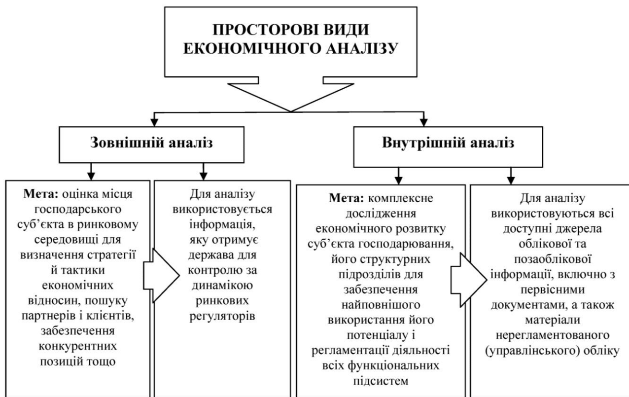
Рис. 1. Просторові види економічного аналізу

Наведене визначення охоплює досить широкий діапазон об'єктів для аналізу. Тому суттєвого значення набуває класифікація його видів, методики дослідження та підходів до його організації, що забезпечить достатню економічність аналітичного процесу. Розглянемо просторові види економічного аналізу, які вірізняються за своїм відношенням до об'єкта дослідження (рис. 1).