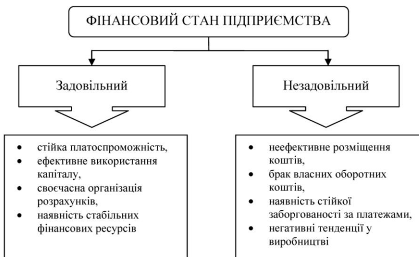
Рис. 3. Показники та фактори фінансового стану підприємства

суб'єкта господарювання, як дохідність і рентабельність.