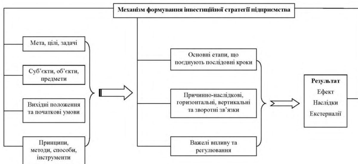
Рис. 2. Елементи механізму формування інвестиційної стратегії підприємства

Отже, механізм формування інвестиційної стратегії підприємства має бути дієвою моделлю, що спрощено можна подати як упорядковану блокову систему. Мається на увазі групування окремих його елементів за спорідненістю в основні блоки, які є послідовними та тісно пов'язані між собою (рис. 2):